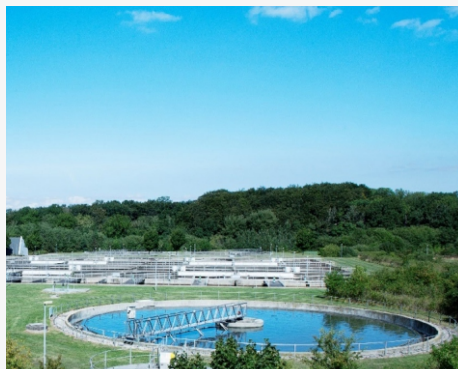
SOLUCIONES DE PAQUETES