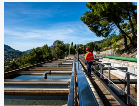
PLANTAS DE TRATAMIENTO DE AGUA Y AGUAS RESIDUALES